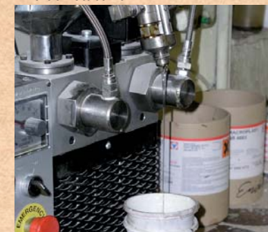
Kleber Mischmaschine. Glue mixer. Клеемешалка.