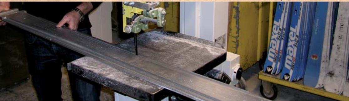
Erstellung der Form. Production of the shape. Заготовка формы..