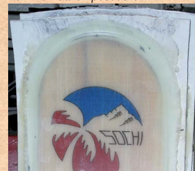
Ski nach der Pressung. Ski after pressing. Льжи после прессовки.