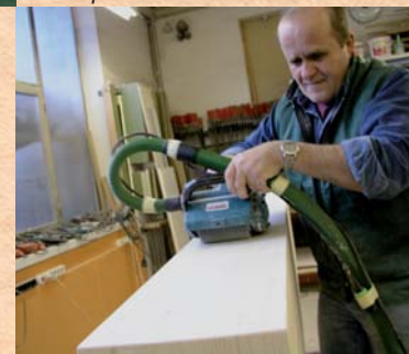
Schleifen der Holzoberfläche. Sanding the surface. Шлифовка деревянной поверхности.