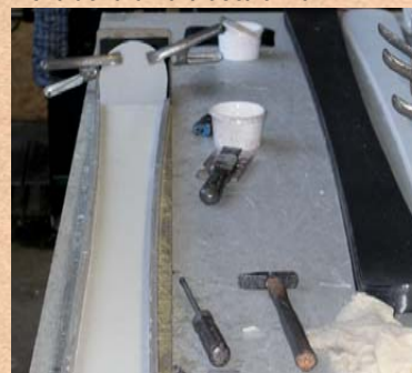
Einlegen der Faser. Laying in the fibre. Укладка стекловолокна.