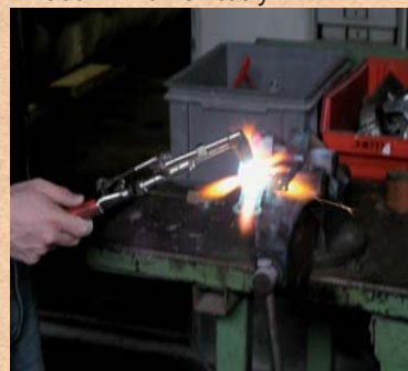
Schlosserarbeiten. Metalwork. Работы по металлу.