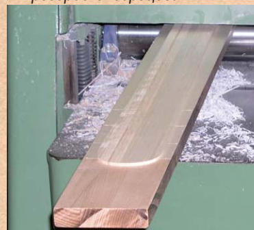
Ausgefräster Kern. Milled core. Фрезеровка сердцевины..