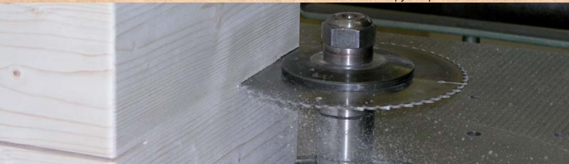
Erstellung der Holzkiste. Preparation of a wooden crate. Изготовление деревянного футляра.