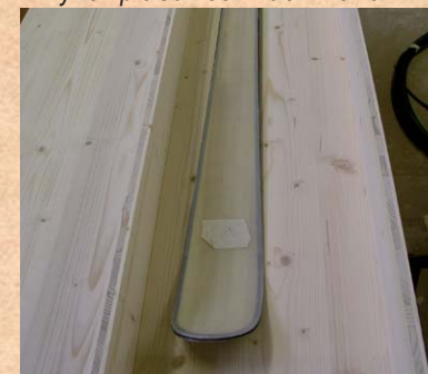
Fertiger Ski in Holzkiste Finished ski in wooden crate. Футляр с готовыми лыжами.