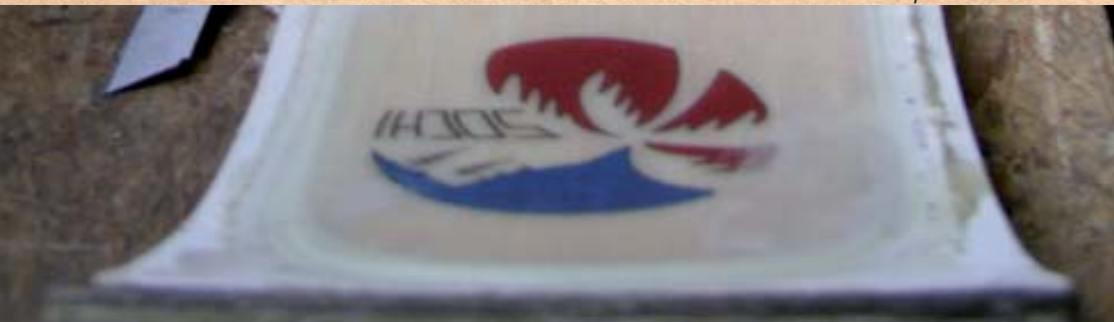
Ski nach der Pressung . Ski after pressing. Льжи после прессовки.