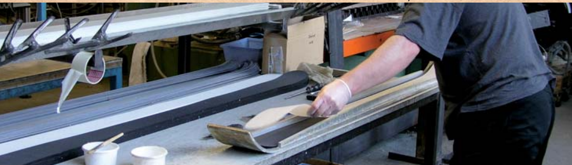
Entwicklung eines Ski. Development of a ski. Разработка лыж.