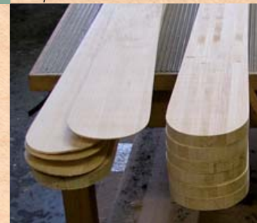
Form. Shape. Форма.