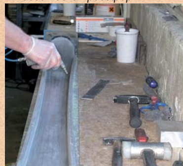
Vorbereitung des Formblechs. Preparing mold. Подготовка прессформы.