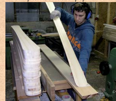
Kontrolle der Form. Controlling the shape . Контроль готовой формы..